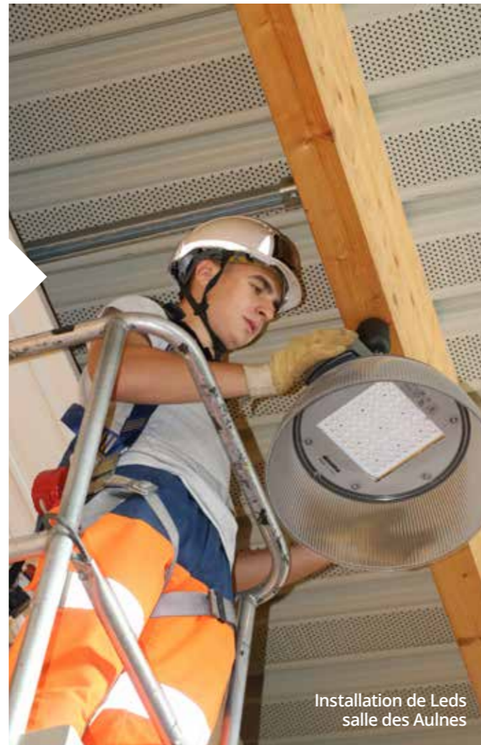
Installation de Leds salle des Aulnes

Le dojo a fait l'objet du remplacement intégral de ses luminaires sodium ; c'est ainsi que 31 projecteurs LED ont été posés au-dessus du tatami et dans les tribunes. Pour une meilleure adaptabilité de la lumière aux événements se déroulant dans le dojo, il est possible de régler la lumière en mode entraînement ou en mode compétition. Coût : 22 991 euros.